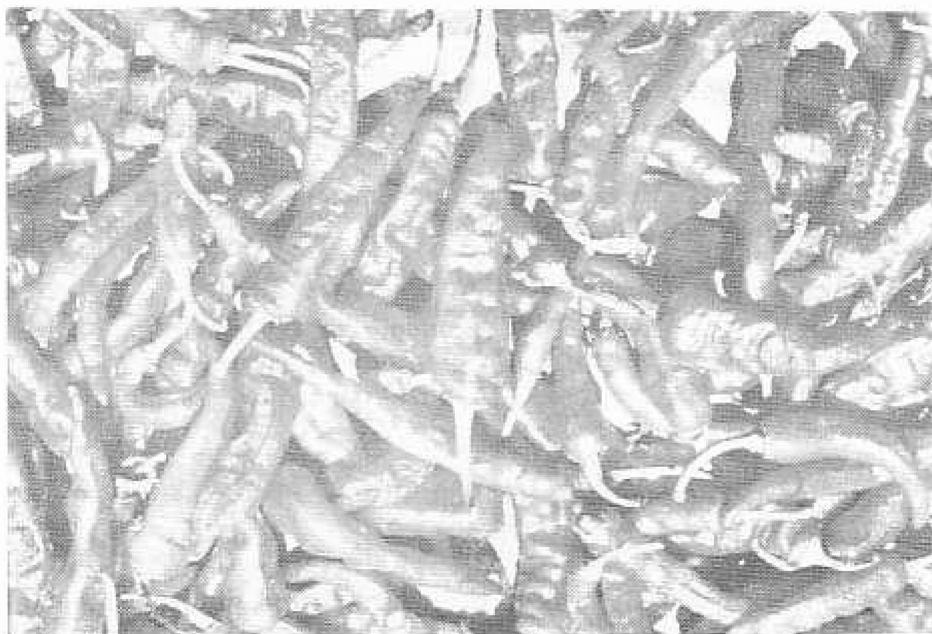
“Chile Cuerdo” ( Capsicum annum ), Llamado así en la región de Las Cruces, La Libertad, El Petén.

que han beneficiado, entre otros, a grupos de campesinos de origen Kekchí, los cuales han llevado consigo sus principales cultivares, dentro de los cuales se cuenta el chile Cobanero. Igual fenómeno ha sucedido con grupos provenientes de la costa sur y oriente de Guatemala, incrementándose de esta manera la variabilidad genética vegetal en el área en donde se establecen.